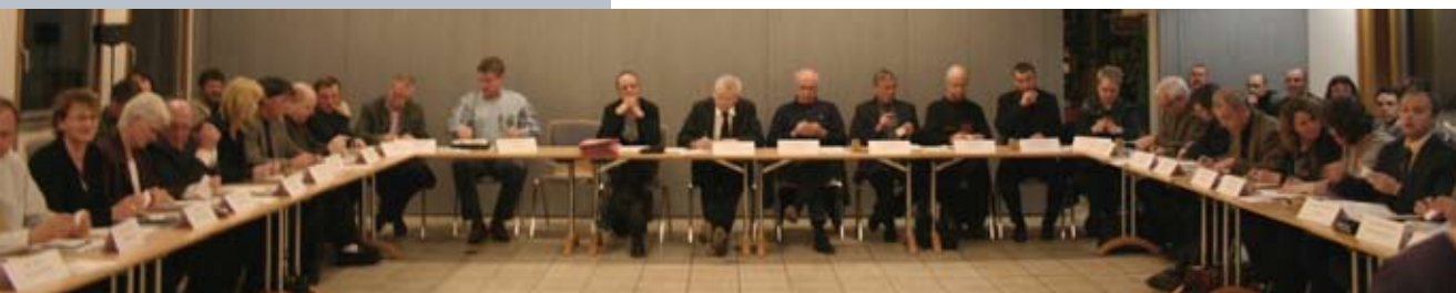
Le premier Conseil Communautaire de cette mandature s'est tenu à la Maison de l'Emploi et de la Formation