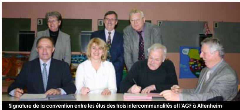
Signature de la convention entre les élus des trois intercommunalités et l'AGF à Altenheim

F ACE à la demande croissante pour l'accueil périscolaire et afin de répondre à tous les besoins, un nouveau service de restauration vient d'être créé dans les locaux de la salle polyvalente de Saessolsheim.