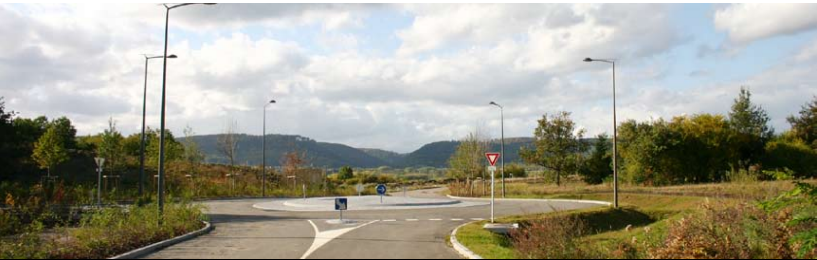
Le Parc Tertiaire du Martelberg dans son cadre géographique privilégié

S UR LES HAUTEURS de la colline sous-vosgienne du Martelberg culminant à 223 mètres d'altitude, se trouvent des voies d'accès flambant neuves serpentant au coeur des vergers. Tout autour, la ligne bleue des Vosges complète l'aspect paysager remarquable du site du Parc Tertiaire du Martelberg. À en voir le calme apparent des lieux, on en oublierait presque que celui-ci bénéficie d'une position géographique avantageuse. En matière d'accessibilité, la gare TGV est à 2km, l'accès à l'autoroute A4 à 4 km et Strasbourg est à 22 minutes par le train et à 40 minutes par la route.