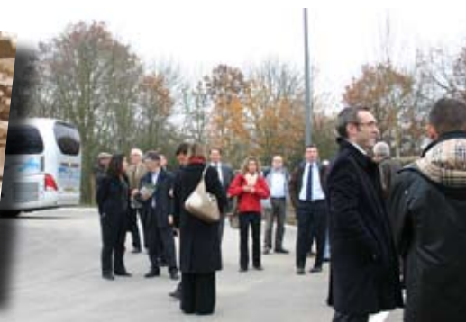
Les futurs acheteurs ont pu admirer le site