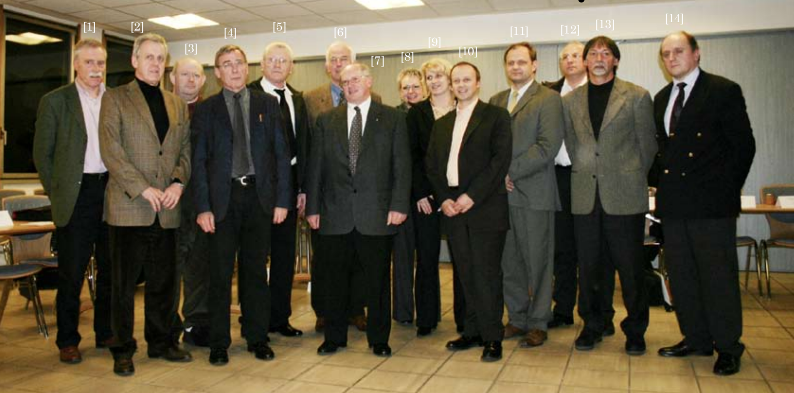
Le bureau de la nouvelle mandature de la Communauté de Communes de la Région de Saverne