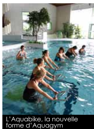
L'Aquabike, la nouvelle forme d'Aquagym

Nouveauté phare de la rentrée, l'Aquabike vient enrichir les activités déjà proposées. Cette activité originale et accessible à tous consiste à pédaler dans l'eau sur un vélo immergé. Elle permet de renforcer ses muscles du bas du corps et fournir un fort travail cardiovasculaire, tout en préservant les articulations et la colonne vertébrale, sans courbatures ni douleurs.