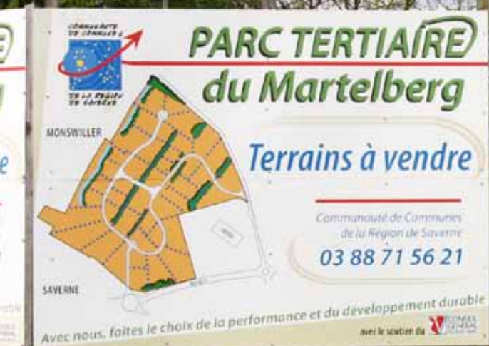
La zone d'activité du Martelberg accueillera sa première entreprise à partir de l'automne.